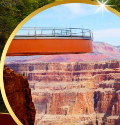
แกรนด์แคนยอน Sky walk