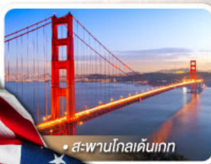
• สะพานโกลเดนเกต

★ เยือนอุทยานแกรนด์แคนยอน ฝั่ง South rim ความมหัศจรรย์ทางธรรมชาติที่ยิ่งใหญ่ที่สุดแห่งหนึ่งของโลก