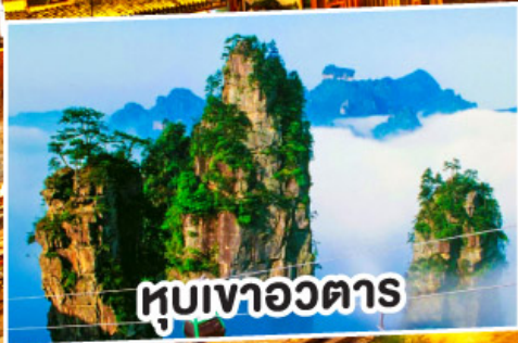
หุบเขาอวตาร