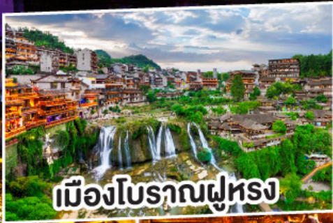
เมืองโบราณผุ่หลง