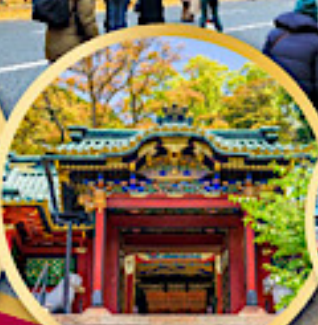
ศาลเจ้าโทโชคุ