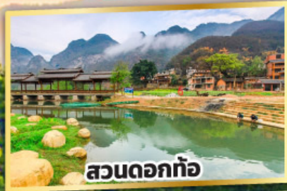
สวนดอกท้อ