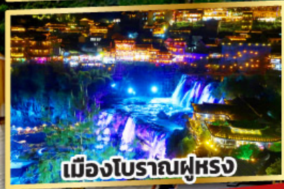
เมืองโบราณฟูหยง