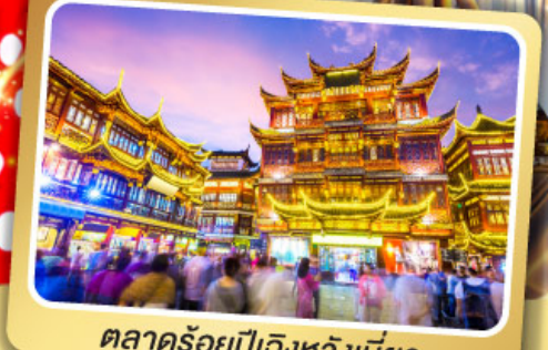
ตลาดร้อยปีเจิ้งหวงเมี่ยว