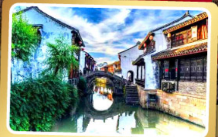
เมืองโบราณเยี่ยเหอ