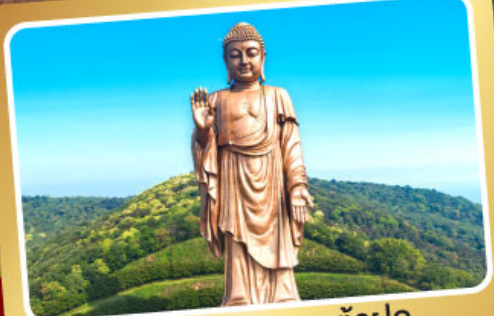
พระใหญ่หลังซานต้าฝอ