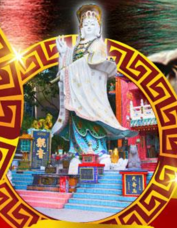
เจ้าแม่กวนอิม หาดริฟส์เบย์