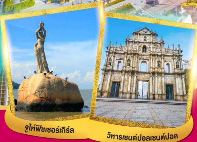
จูไห่พีชเชอร์เกิร์ล