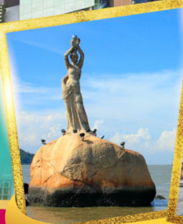
จูไห่ฟิชเชอร์เกิร์ล