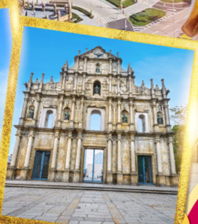
วิหารเซนต์ปอลเซนต์ปอล