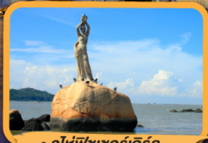
• จูไห่ฟิชชอร์เทอริส