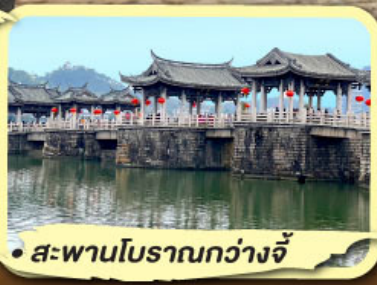
• สะพานโบราณกว้างจี้