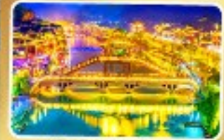
เมืองโบราณเฟิ่งหวง