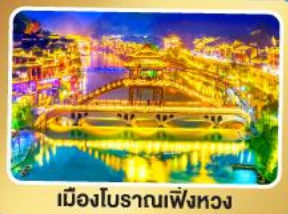
เมืองโบราณเฟิ่งหวง