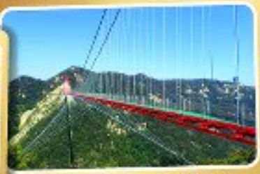
สะพานแขวนอ้ายจ้าย