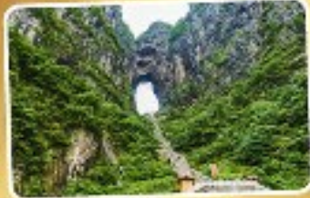
เขาเทียนเหมินซาน