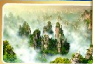
เขาอวตาร