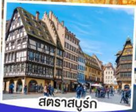
สตราสบูร์ก