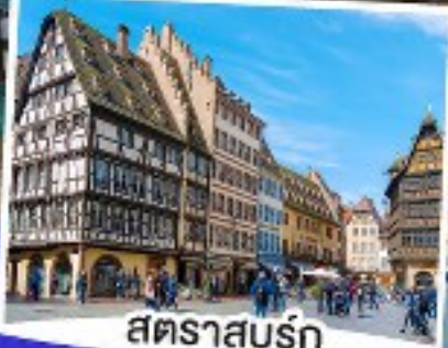
สตราสบูร์ก