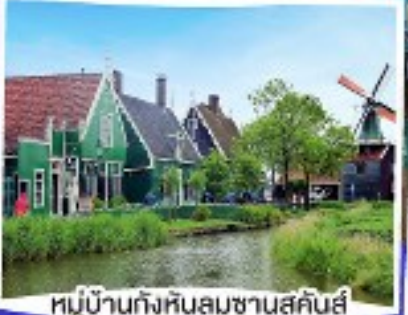
หมู่บ้านกังหันลมชานสคินส์