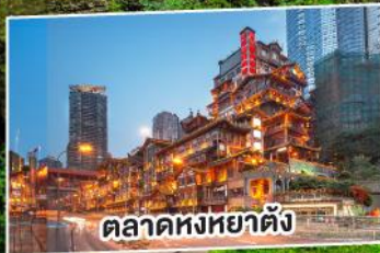
ตลาดหงหยาดัง