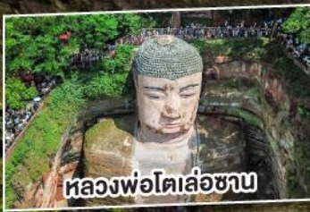
หลวงพ่อโตเล่อซาน