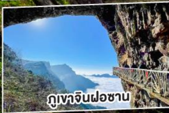
ภูเขาจินฝอซาน