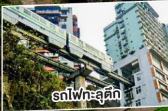
รถไฟความเร็วสูง