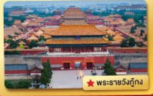
★ พระราชวังกู้กง