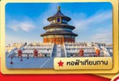
★ หอฟ้าเทียนถาน