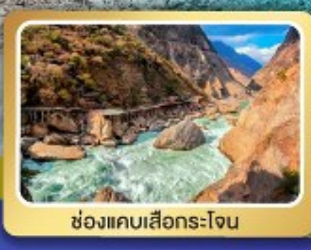
ช่องแคบเสื่อกระโจน