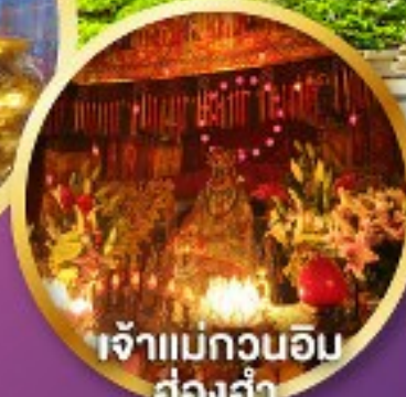
เจ้าแม่กวนอิม ฮ่องกง