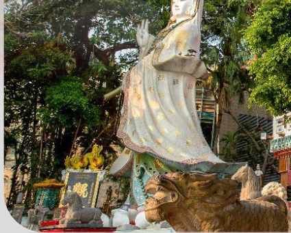
GO1HKG-EK035 Hong Kong ช่องกง สายมูทันใจ ไหว้พระ 9 วัด 3 วัน 2 คืน โดยสายการบิน Emirates (EK)