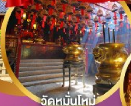
วัดหมื่นโหม่