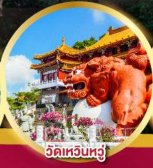
วัดเหวินหวู่