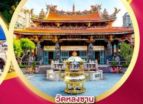
วัดหลงซาน