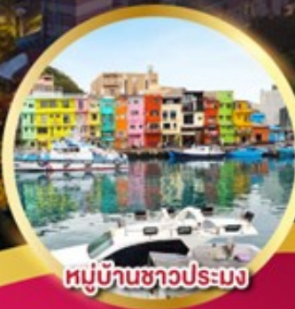
หมู่บ้านชาวประมง