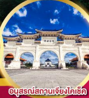
อนุสรณ์สถานเจียงไคเช็ค