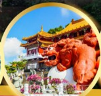
วัดเหวินหวู่