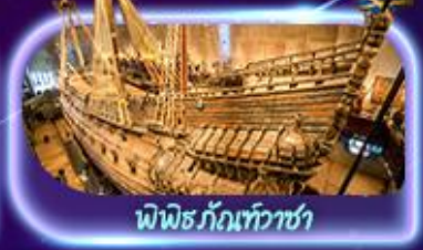
พิพิธภัณฑ์ทว่าซา