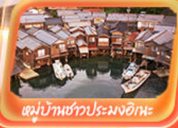
หมู่บ้านชาวประมงอิหะ