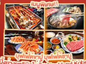
บุฟเฟ่ต์ญี่ปุ่น สเต็กคินโอบี Steakland Kobe