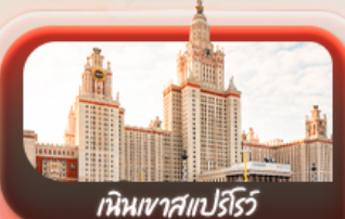
เห็นเขาสเปร์ไรซ์