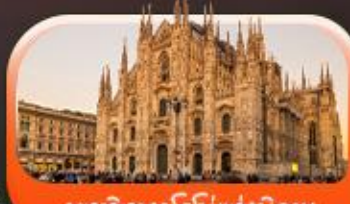
มหาวิหารดูโอโมแห่งมิลาน