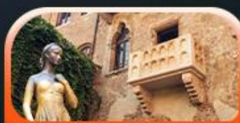
บ้านของจูเลียต

พิเศษ ขึ้นกระเช้าชมวิวเขาโดโลไมท์ ALPE DI Siusi