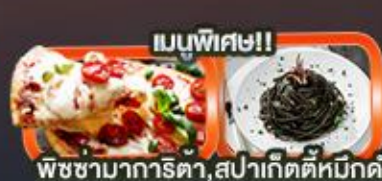
เมนูพิเศษ!! พิซซ่าการิตตา, สปาเก็ตตี้หมักดำ