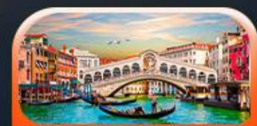
คลองเรือชมเกาะเวนิส