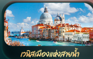
เวนิสเมืองแห่งสายน้ำ