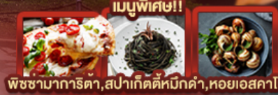
เมนูพิเศษ!! พซชามากริตต้า, สปปาเก็ดตีหมักดำ, หอยเอสคาโก้