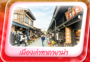
เมืองเก่าทาคายามา