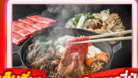
เต็มอิ่ม! บุฟเฟ่ต์ชาบูญี่ปุ่น