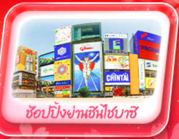
ช้อปปิ้งย่านชินไซบาชิ