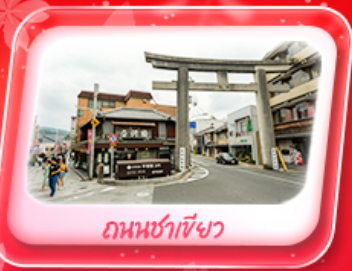
ถ่านชาอิซึ