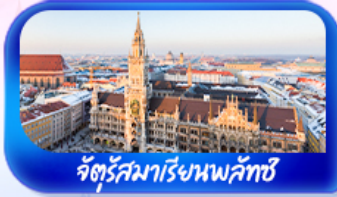
จัตุรัสมาเรียนพลาทซ์