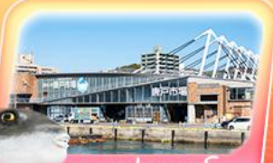
ตลาดปลาคาราโตะ

สัมผัสกลิ่นอายญี่ปุ่นแท้ที่ศาลเจ้าคาโซฟู จอพรวัดนินโซอิน เดินเล่นหมู่บ้านยูฟูอินสุดน่ารัก ชมวิวทะเลสาบคินริน ย้อนอดีตกับ โมจิโกะ เรโทร นั่งเรือเฟอร์รี่ เช็คอินตลาดปลาคาราโตะ ถ่ายภาพปราสาทโคคุระ ช้อปบิงจุใจที่ เอากะเล็คคิตะคิซุ