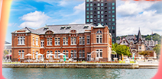
โมจิโกะ เรโทร