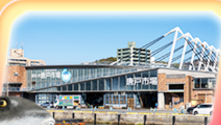
ตลาดปลาอาราโตะ

✈️ สายการบิน Vietjet Air (VZ) น้ำหนักกระเป๋า 20 KG vietjetair.com