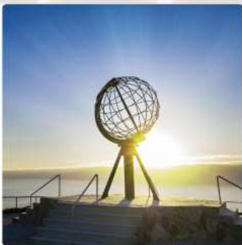
สัมผัสดินแดนไวกิง ชมพระอาทิตย์เที่ยงคืน