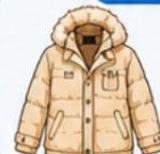
เสื้อโค้ทกันหนาว ตัวหนา