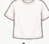
เสื้อยืด