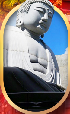
พระใหญ่อะตะมะ