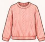
เสื้อสเวตเตอร์ถัก หรือคาร์ดิแกน