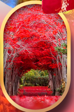
สวนฮิราโอกะ