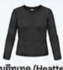
สวมฮีทเทค (Heattech) แบบหนาที่แขนด้านใน