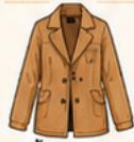
เสื้อแจ็กเก็ต หรือโค้ทตัวยาว