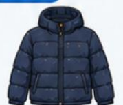
เสื้อขนเป็ด