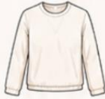
เสื้อแขนยาว