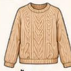
เสื้อไหมพรม