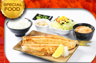
เมนูพิเศษ Set ปลาซอกเกะ