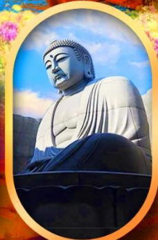
เนินเงาแห่งพระพุทธรเจ้า