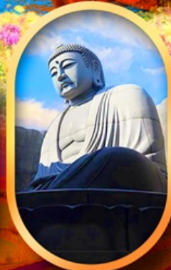
เบ็นเนาแห่งพระพุทธรเจ้า