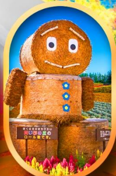
ซึกิโซ โนะโอะกะ