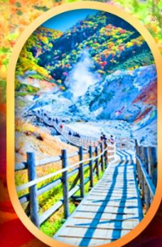
หุบเขานรกจิกุคุดาบี