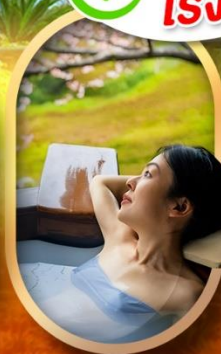
แช่บ่อออนเซ็นญี่ปุ่น