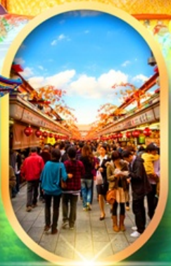
ถนนนากามิเสะ