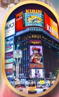
ช้อปปิ้งย่านซูซึกิโนะ