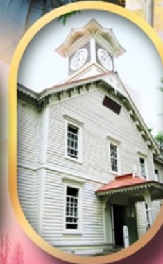
ผ่านชมหอนาฬิกา