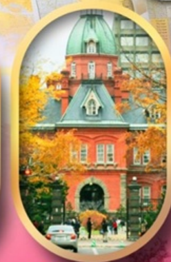
ศาลาว่าการเก่า