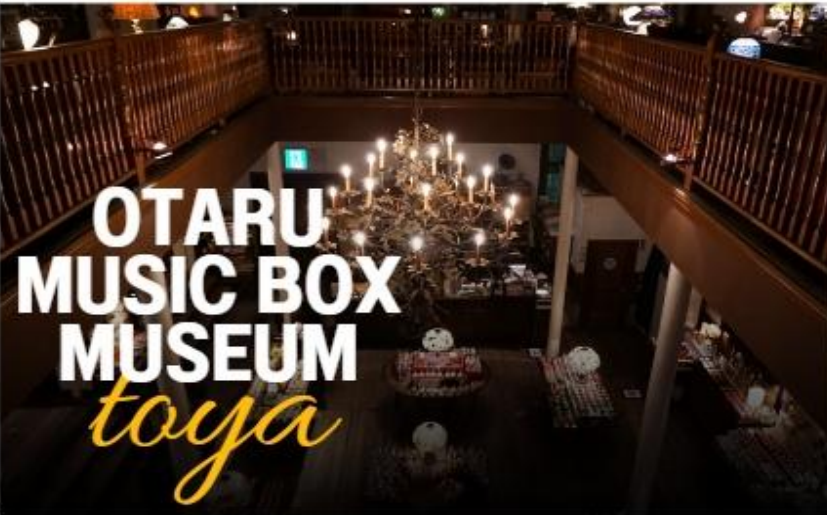
OTARU MUSIC BOX MUSEUM toya

นำทุกท่านเดินทางสู่ พิพิธภัณฑ์กล่องดนตรี (MUSIC BOX) ท่านจะได้ชมกล่องดนตรีมากมาย หลากหลายแบบน่ารักๆ เต็มไปหมดมากกว่า 3,000 แบบ รวมถึงท่านยังสามารถเลือกทำกล่องดนตรีแบบที่ท่านต้องการได้ด้วย ท่านสามารถเลือกกล่องใส่ ตุ๊กตาเซรามิกและเพลงมาประกอบกัน มีบริการนำเพลงกล่องดนตรีทั้งเพลงญี่ปุ่นและเพลงสากลมาอัดเป็นซีดีไปสการ์ดส่งได้