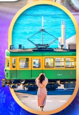
ถนนโคมาจิโคริ