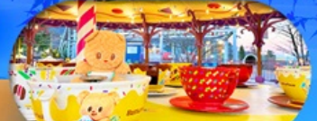
Fuji q Highland x Butterbear เดินทาง พ.ค. 69 เป็นต้นไป