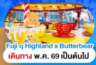
Fuji Q Highland x Butterbear เดินทาง พ.ศ. 69 เป็นต้นไป