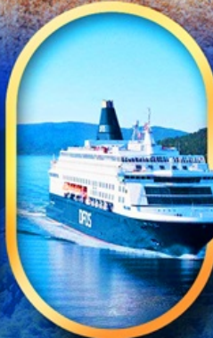
นั่งเรือ DFDS