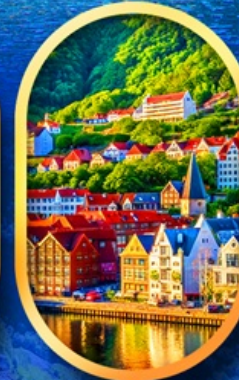
พิกเมืองเบอร์เก็น