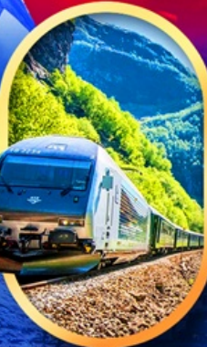
รถไฟฟลิมสบาน่า