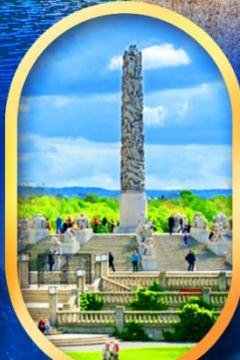
วิกเทอร์แลนด์