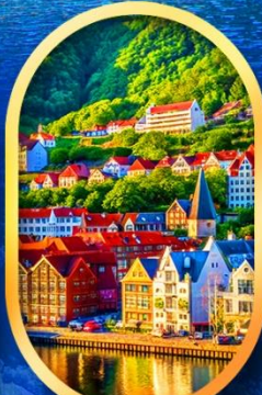
พักเมืองเบอร์เก็น