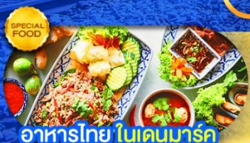
อาหารไทย ในเดนมาร์ก