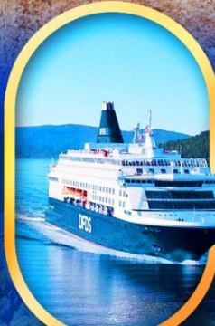
นั่งเรือ DFDS