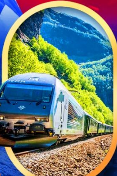
รถไฟฟลัมสนาน่า