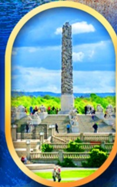
วิกเกอร์แลนด์