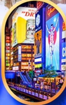
ย่านชินโซบาชิ