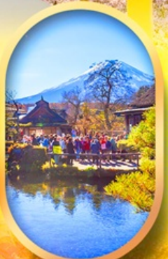
หมู่บ้านน้ำใส