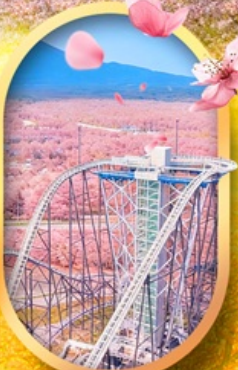
ฟูจิยาม่า ทาวเวอร์