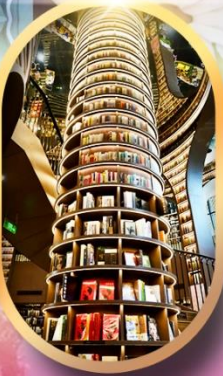
หอหนังสือจุงชูก่อ