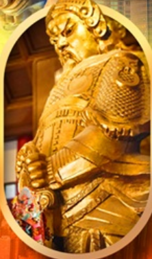
ทองพรวัดเซ่งจ๊อ

เที่ยว 2 ประเทศ 4 พอร์ 4 วัดดัง ช้อปปิ้งจุใจ