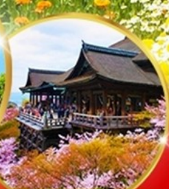
วัดคิโยมิจิ