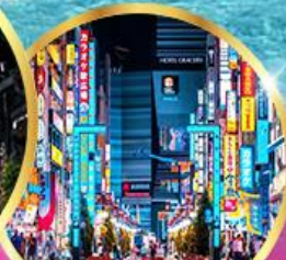
ซัปโปโรชินจูกุ