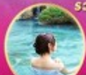
พักผ่อนแช่น้ำ 1 คืน