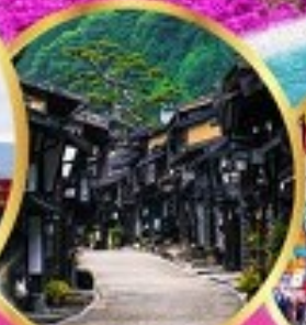
นาราจุกุ