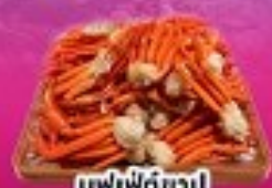
บุฟเฟ่ต์ซาปู