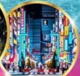
ชิโอมิงชินจุกุ