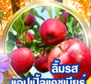
ลิ้มรส แอปเปิ้ลแคชเมียร์