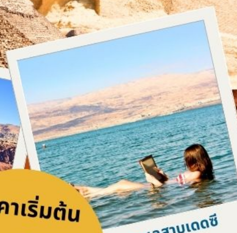
ทะเลสาบเดดซี