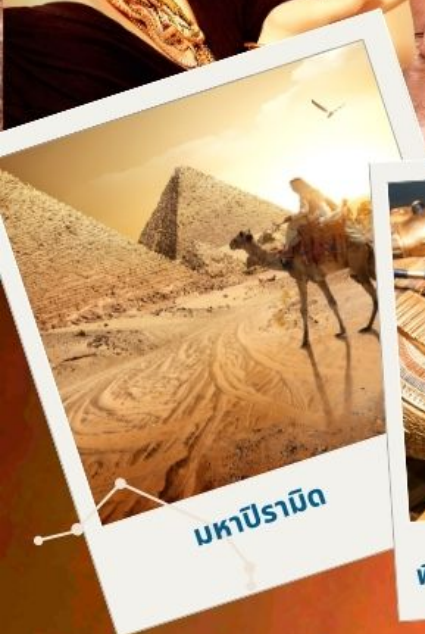
มหาปิรามิด