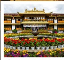
ตำหนักนอร์มูหลินมา

ชมวิวยอดเขานานเจียปาหว่า / จุดชมวิวกะเลปาหลูกลาง / อุทยานเขาเป็นยี่ / ระเบียบกระจก / วัดลามะ พระราชวังโปตาลา / วัดโจคัง / ถนนแปดเหลี่ยม / ทะเลสาบนำมู่ซั่ว / ตำหนักนอร์มูหลินมา / เมืองโบราณลั่วใต้