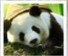
ดูแม่กบิเบต

อุทยานหวงหลง / อุทยานจิวจ้ายโกว / ไร่ทิเบตดูแม่กบิเบตที่เหม่ฉางจิวจ้ายโกว / สวนดอกไม้ทิเบต / ไร่เบิ่งเซ่กั๋ว / ถนนถนนเดินสู่มิเบต / ถนนโบราณจีนทิเบต