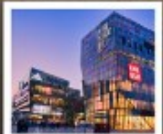
ย่านซานหลี่ตุ่น