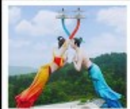
WULONG FLYING KISS