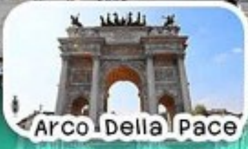
Arco Della Pace

เที่ยว มิลาน-เจนัว-ปิซ่า-ฟลอเรนซ์- โบโลญญา-โคโม ดื่มด่ำบรรยากาศสวยงามริมทะเลสาบโคโม ชมหอเอนปิซ่าและมหาวิหารแห่งฟลอเรนซ์ ชิมพิซซ่าและพาสต้าสดอิตาเลียนแท้ๆ ช้อปปิ้งแบรนด์ดังอย่างจุใจที่มิลาน Galleria Vittorio Emanuele II แล: Fidenza Village Outlets