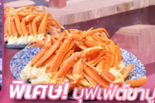
พิเศษ! บุฟเฟ่ต์ซาซุ