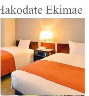
Hotel Flexstay Hakodate Ekimae