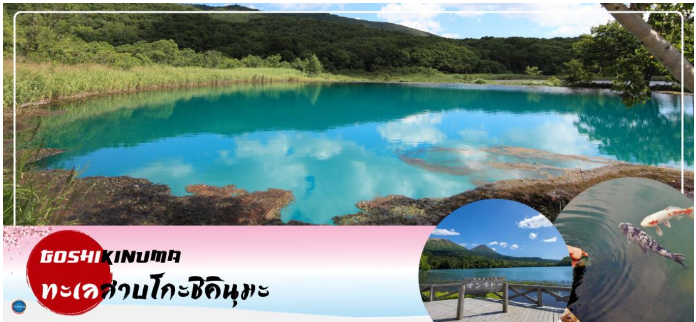
GOSHIKINUMA ทะเลสาบโกะชิคินุมะ

วันที่สาม เมืองฟุกุชิมะ – ทะเลสาบโกะชิคินุมะ – เมืองไอสุ – วัดเอ็นโซจิ – หมู่บ้านโออุจิ จุคุ – สถานีรถไฟยูโนดามิ ออนเซ็น – ปราสาทสึรุกะ (ด้านนอก)