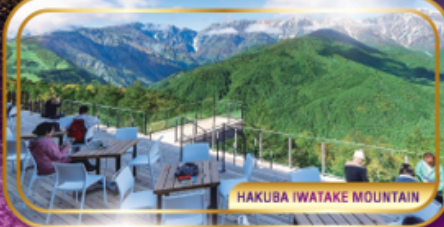
HAKUBA IWATAKE MOUNTAIN