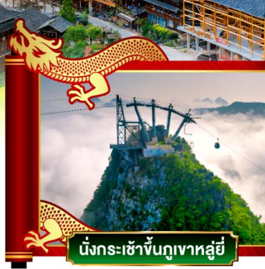
นั่งกระเช้าขึ้นภูเขาหลูอี้